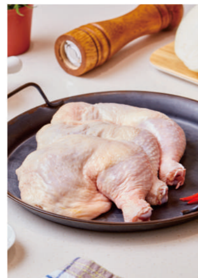
【單凍】 生鮮腿肉排 (帶腳蹠/去腳蹠)

強匠冷凍食品所使用之生鮮原料，為選用檢驗合格之電宰豬肉與雞肉，並以專業的原料分切技術、多項檢驗與高端冷凍倉儲設備，具備完整的原料優勢。提供專業客製化、代工、原料採購等服務。