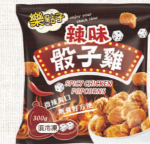
樂點子 辣味骰子雞 300g

特選口感扎實雞腿肉，搭配獨家黃金比例裹粉與醃料，外皮金黃酥脆，小巧一口鮮嫩多汁，一口一個剛剛好，解饞聚會最佳點心新選擇。