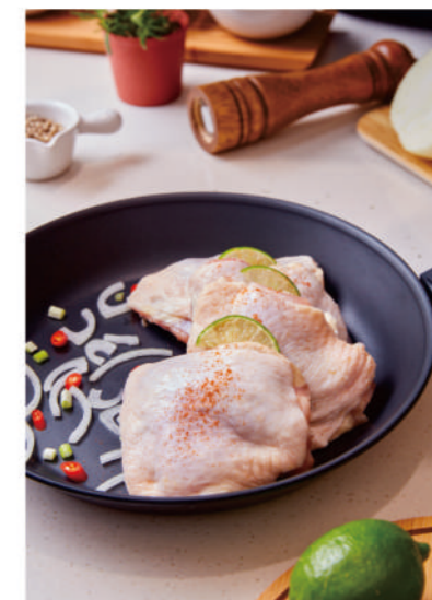
【單凍】 雞排塊 IQF