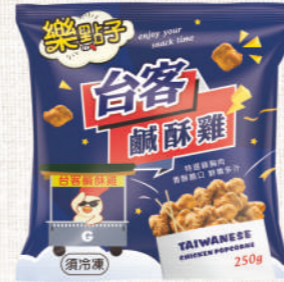
樂點子 台客鹹酥雞 250g

特選口感扎實雞胸肉，搭配獨家黃金比例裹粉與醃料，經過 180 度的油炸，炸出金黃酥脆、肉質軟嫩的台味鹹酥雞，最台、最道地，涮嘴一口接一口。