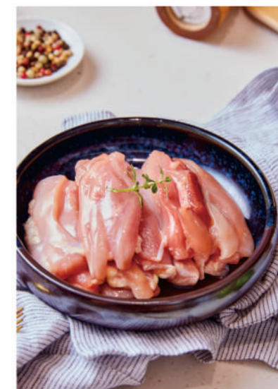
生鮮雞腿肉 (去皮腿肉)