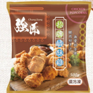
強匠 招牌鹹酥雞 500g

特選口感扎實雞腿肉，搭配獨家黃金比例裹粉與醃料，外皮金黃酥脆，小巧一口鮮嫩多汁，微辣口感，爽口好吃，一口一個剛剛好，解饞聚會最佳點心新選擇。