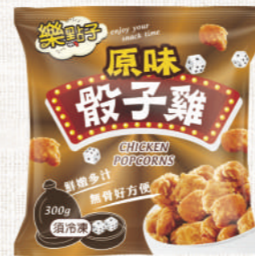
樂點子 原味骰子雞 300g

特選口感扎實雞胸肉，搭配獨家黃金比例裹粉與醃料，經過 180 度的油炸，炸出金黃酥脆、肉質軟嫩的台味鹹酥雞，最台、最道地，涮嘴一口接一口。