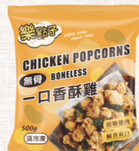
樂點子 一口香酥雞 500g

嚴選上等雞腿肉，使用中式天然香料調製，香脆可口、鮮嫩有層次，再現台灣傳統鹹酥雞風味。