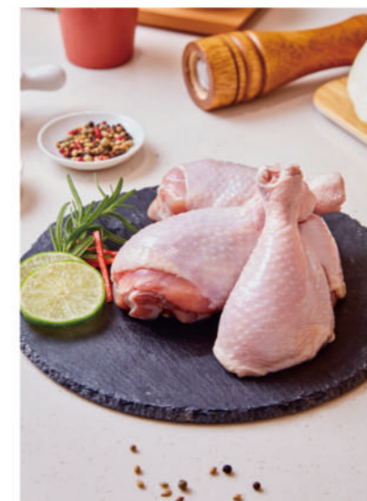
【單凍】 生鮮棒腿 (美規/台切)