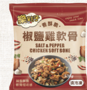
樂點子 椒鹽雞軟骨 500g

嚴選鮮嫩雞肉，以獨家特調比例調味，軟嫩多汁，口齒留香。外皮以專業裹粉技術，香酥可口，外脆內嫩、香氣撲鼻，令人食指大動。